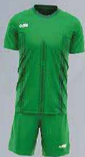
Réf: Brique rodado